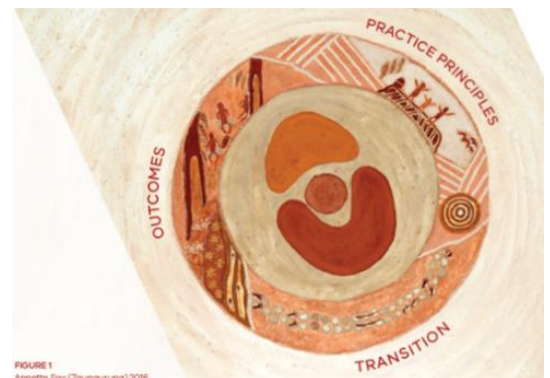
FIGURE 1 Annette Sax (Thungurung) 2016

Yongala 幼儿园致力于良好的治理和管理，通过持续自我评估、规划和审查周期提供高质量的成果；嵌入质量改进的文化。持续改进、最佳实践和高质量成果是我们实践的基础。通过持续的批判性反思过程，在服务独特性的背景下考虑和应用当前的研究、理论和理解。