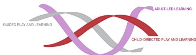
FIGURE 4: INTEGRATED TEACHING AND LEARNING APPROACHES

我们受到 Vygotsky's 的社会建构主义理论、Bronfenbrenner 的生态理论、Erikson 的心理动力理论、Reggio Emilia 教育项目的影响，并根据 Howard Gardner 的多元智能概念构建课程。